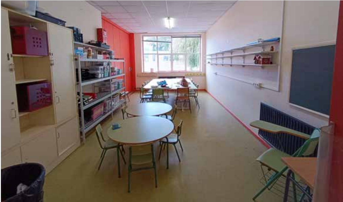
Sala de arte

Outros espazos que o CEIP pon a disposición da ANPA, coma o local social e a sala de arte, tamén foron mellorados para enriquecer e facer máis agradable a experiencia da cativada durante o tempo que están facendo uso dos servizos da ANPA.