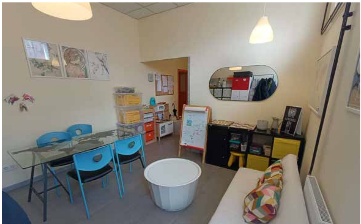
Local social da ANPA: zona de xogo e descanso para a cativada que o precisa