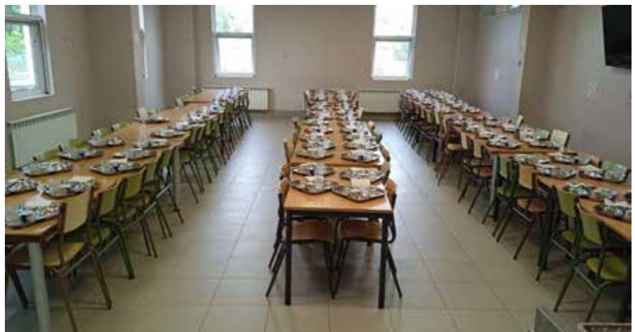
Imaxes do comedor antes do cambio de mobiliario por parte da ANPA