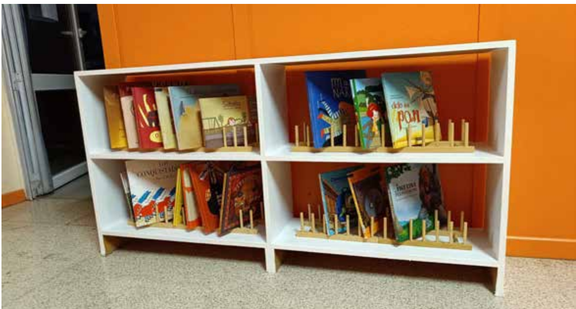
Lecturas para a cativada de Mañanceiros e Comedor