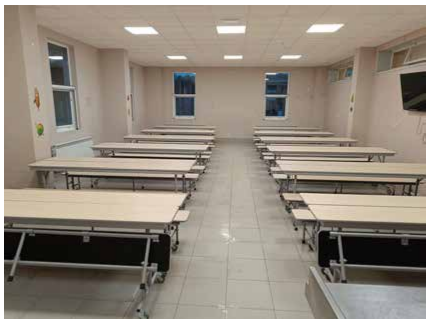
Imaxes do comedor na actualidade